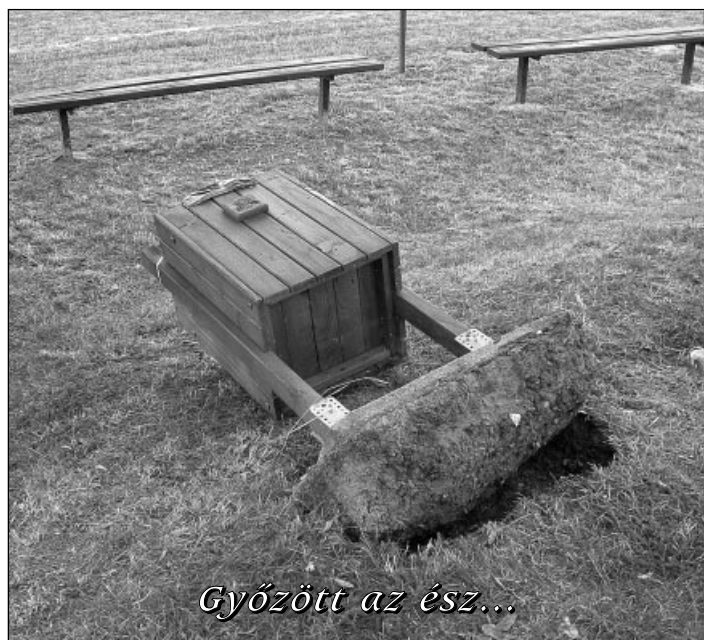
Győzött az ész...