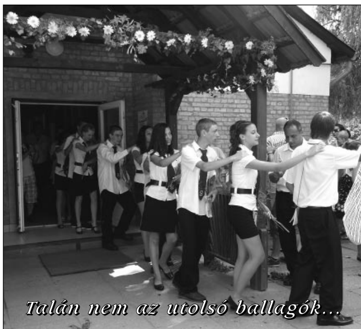
Talán nem az utolsó ballagók...