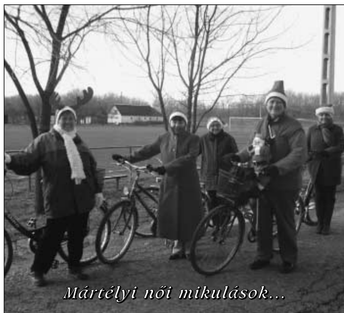
Mártélyi női mikulások...