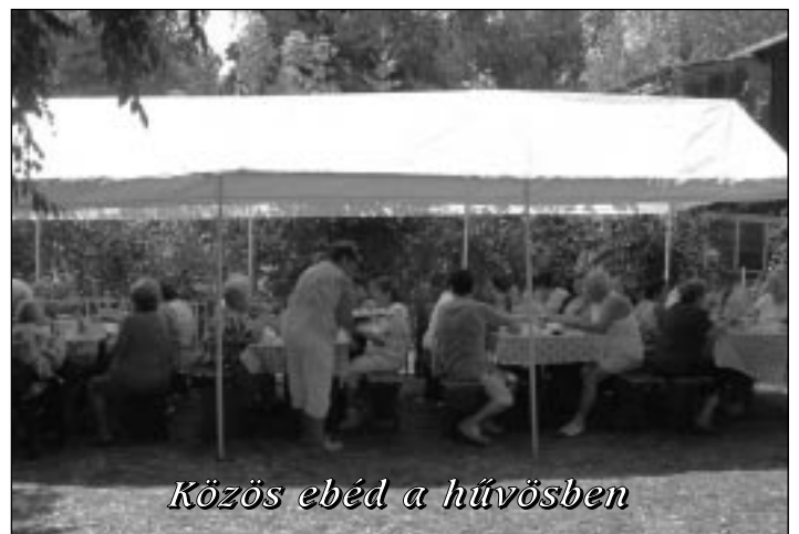
Közös ebéd a hűvösben

A meleg, de emlékezetesen jó nap a kora délutáni órákban ért véget, mint minden ilyen rendezvény, a „nemszeretem” munkálatokkal, bontással, rendrakással, mosogatással, búcsúzással.