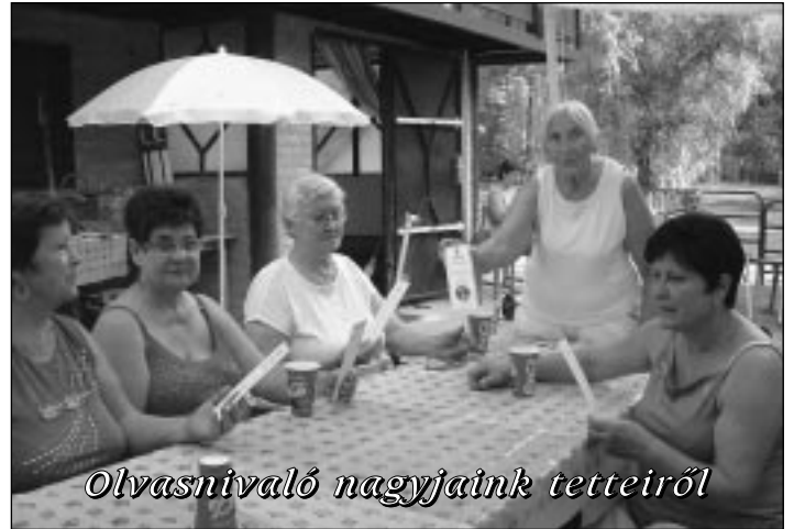
Olvasnivaló nagyjaink tetteiről

kü adománya, a közkedvelt percc és sós stangli, hogy beszélgetés közben is jusson egy kis nassolnivaló az asztalokra, sőt egy ismeretlen tisztelő jóvoltából érett sárgadinnye szeletekkel is nyomatékosan tehetett mindenki a tartalmas ebédre, ha éppen arra volt gusztusa.