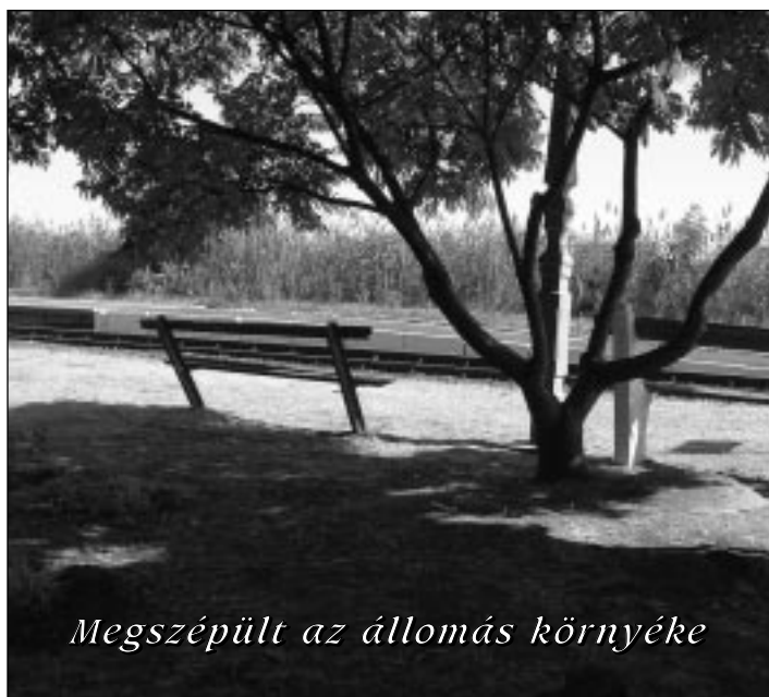
Megszépült az állomás környéke

„Magyarországon az egy főre eső bunkók száma: kettő.” (Hofi Géza)