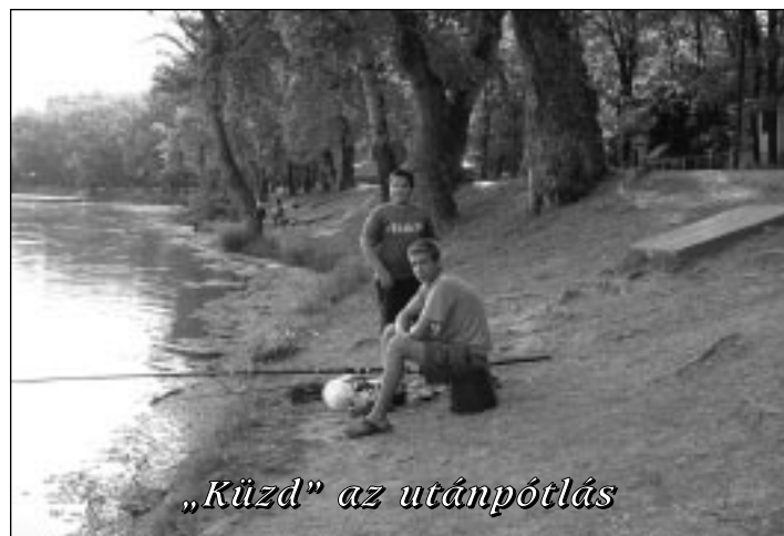
„Küzd” az utánpótlás