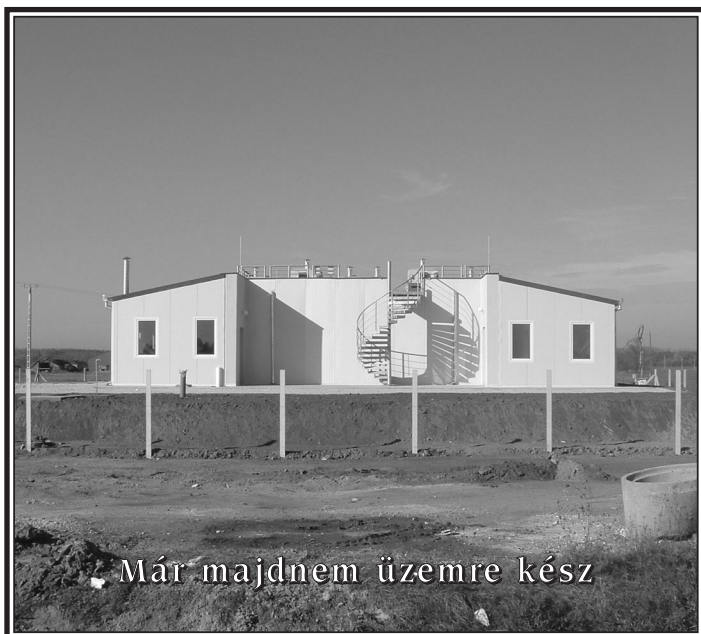
Már majdnem üzemre kész

„Embernek születni nem – hanem annak megmaradni – az állati nehéz – (Lupus)