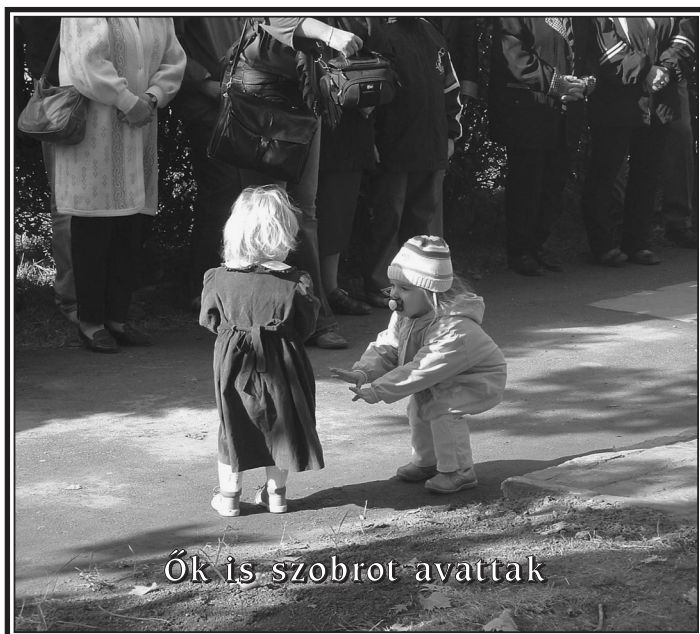
Ők is szobrot avattak