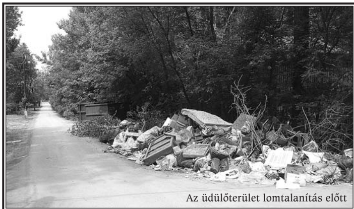
Az üdülőterület lomtalanítás előtt