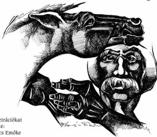
Az illusztrációkat készítette: B. Kovács Emőke