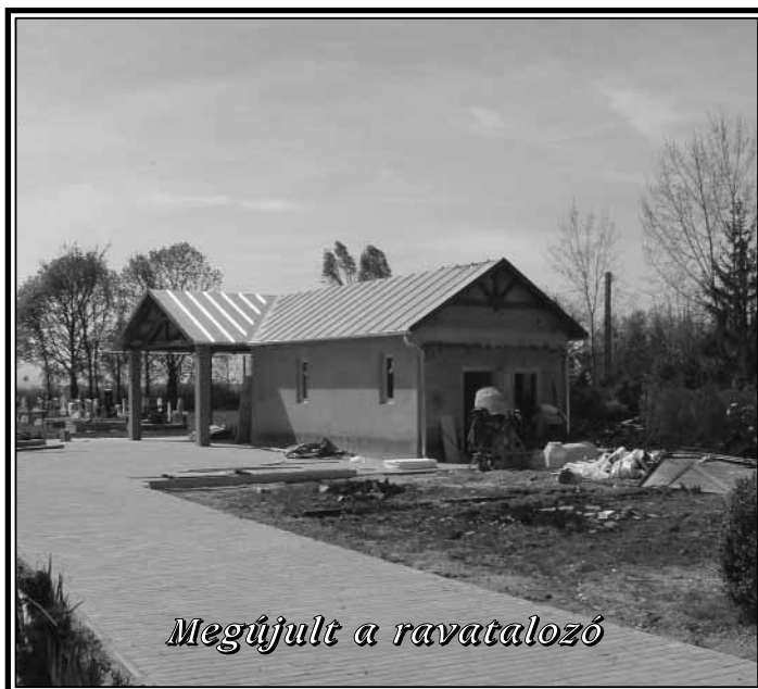
Megújult a ravatalozó